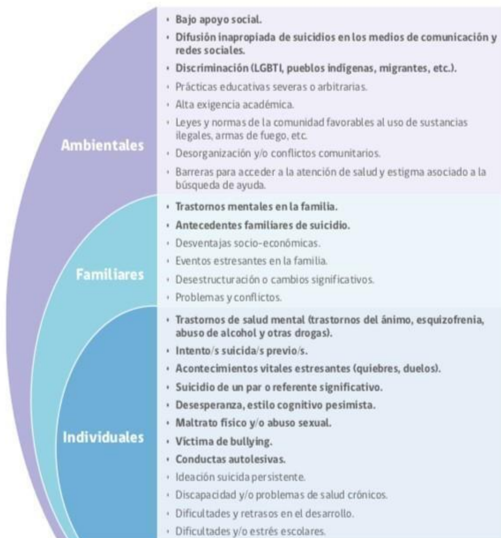
FIGURA 1. FACTORES DE RIESGO CONDUCTA SUICIDA EN LA ETAPA ESCOLAR