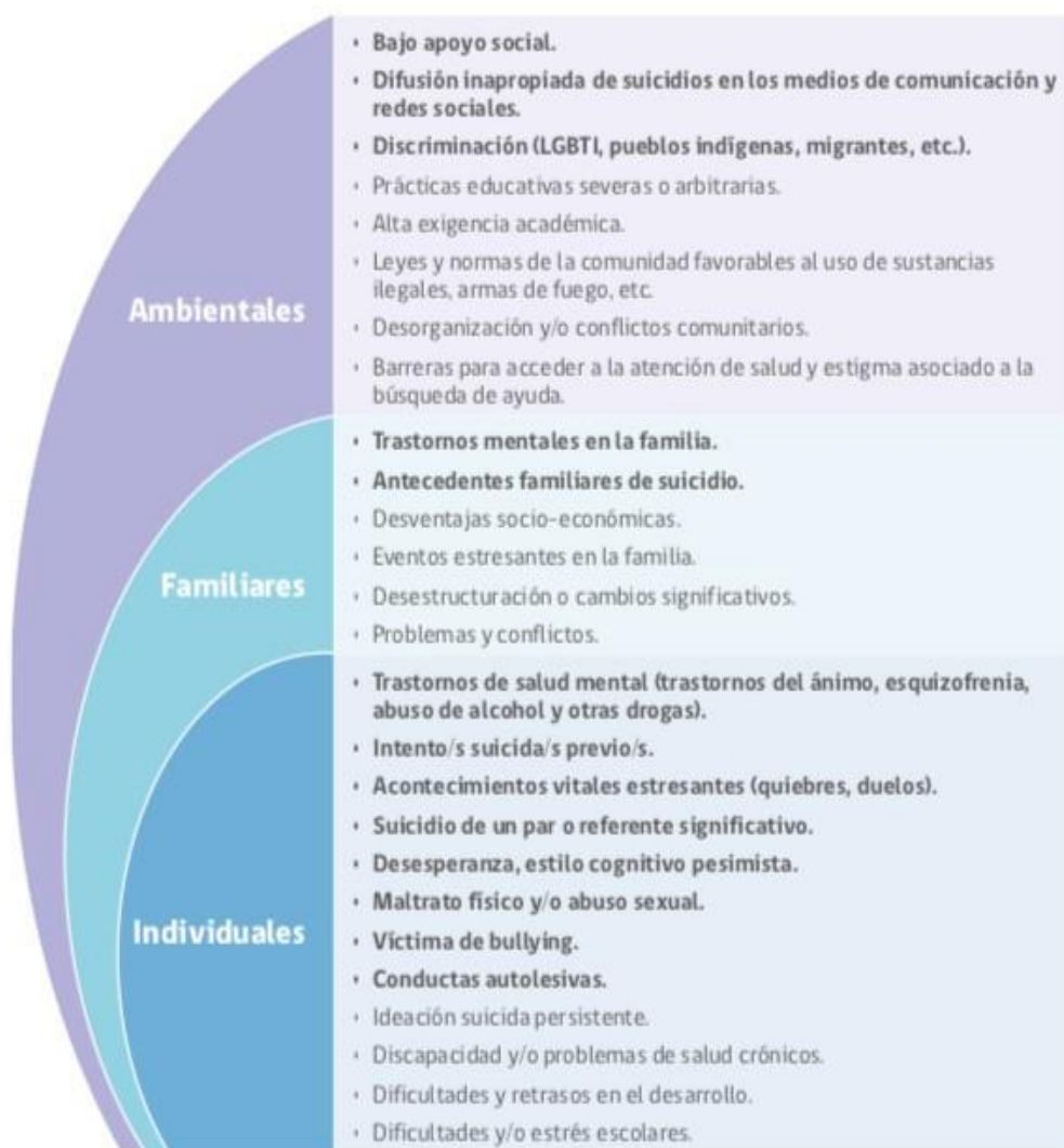
FIGURA 1. FACTORES DE RIESGO CONDUCTA SUICIDA EN LA ETAPA ESCOLAR